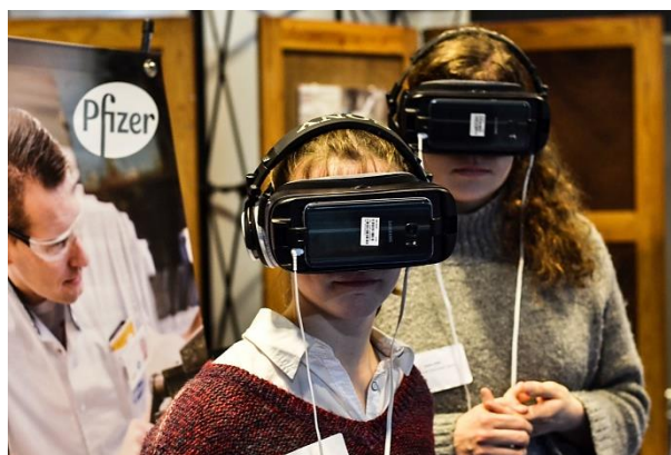
Jobbeurs Pfizer