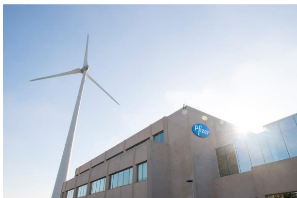
Pfizer te Puurs

Pfizer Puurs, de grootste productie- en verpakkingssite van Pfizer in Europa, blijft in sneltempo groeien. In de laatste zeven jaar heeft de vestiging meer dan duizend werknemers aangenomen. De geneesmiddelenproducent zoekt ook dit jaar technisch talent. Daarom organiseert Pfizer Puurs op zaterdag 21 april een jobdag. De vorige editie in november 2017 bleek een schot in de roos, want 1 op 5 bezoekers tekende finaal een contract. Geïnteresseerden voor de jobdag kunnen zich tot en met 19 april inschrijven via de website www.pfizerzoektjou.be .